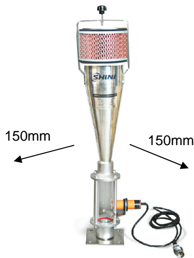
图 3-1：机器安装位置图

机器安装时，确保充分的安装空间(机器的四周至少预留 150mm)，如图所示。安装在狭窄空间时，不利于机器的运行及机器的检查和维修。不要在机器上面置放东西。机器的四周不可放置易燃易爆物品。